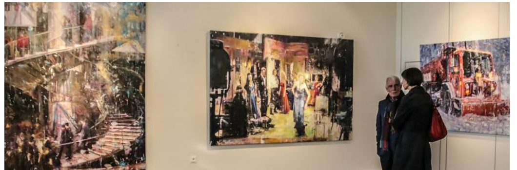
Grand escalier du Louvre, Screen Test Variation, Dénéigeuse : des thèmes très divers.

En coréalisation avec Delphine Courtay et l'agence des artistes, spécialiste de l'art contemporain (DNA 14 janvier), le Pôle culturel de Drusenheim vient de présenter son avant-dernière exposition de la saison.