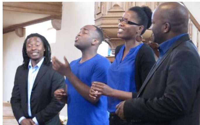
The Sparkle Family a partagé avec les auditeurs leur joie de chanter des airs gospel.

The Sparkle Family proposait donc un répertoire principalement gospel aux arrangements originaux. Les trois chanteurs de talent,