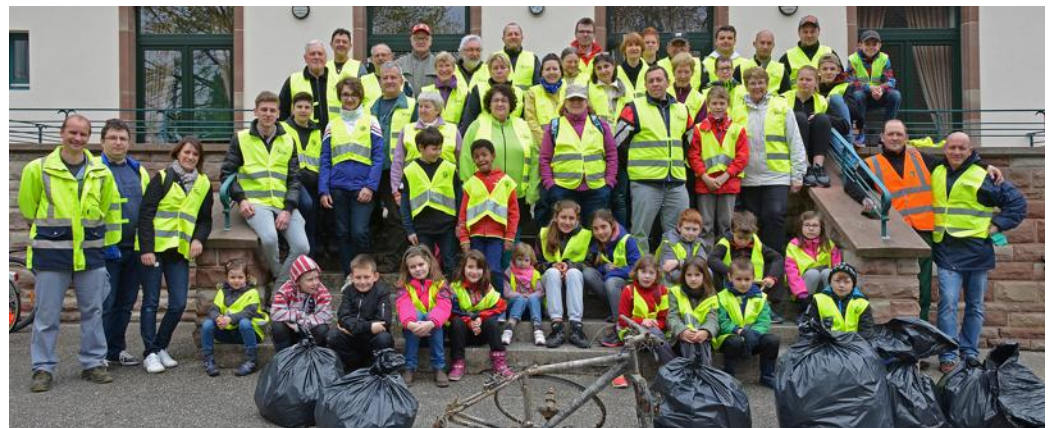
Près de 70 bénévoles mobilisés contre les déchets.

Avec l'arrivée de la belle saison, tous avaient le cœur à l'ouvrage pour redonner un coup d'éclat à certains sites du village souvent malmenés par des usagers ou des promeneurs peu respectueux du cadre de vie. Le City stade, le centre-ville, l'aire de jeux, les